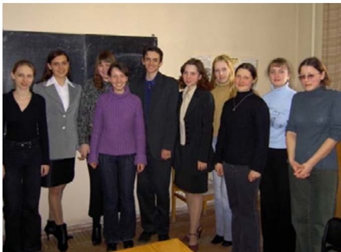
На фото - старшая группа участников олимпиады